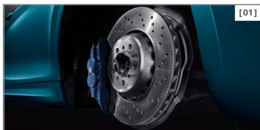
[01] M Compound Bremse