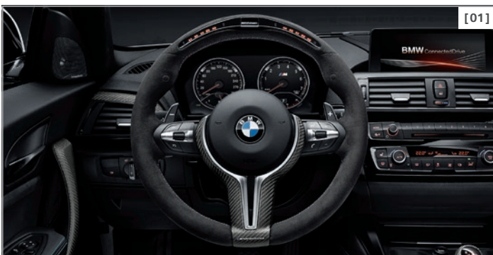
[01] Carbonblende für das M Lederlenkrad