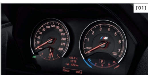
[01] Instrumentenkombination mit erweiterten Umfängen und roten Zeigern

inkl. Check-Control und Außentemperaturanzeige, Serviceintervallanzeige und Restwegstrecke