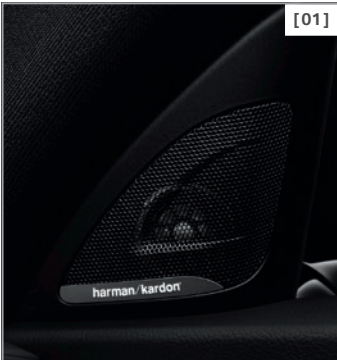
[01] Harman Kardon Surround Sound System

BMW ConnectedDrive – Allgemeine Informationen und Laufzeiten Weitere Informationen zu BMW ConnectedDrive, insbesondere zu den Laufzeiten der Dienste, erhalten Sie auf Seite 30 dieser Preisliste, unter www.bmw.de/ConnectedDrive_Informationen oder bei der BMW ConnectedDrive Hotline unter 089 1250 160 10 von Montag bis Sonntag von 8.00–20.00 Uhr .